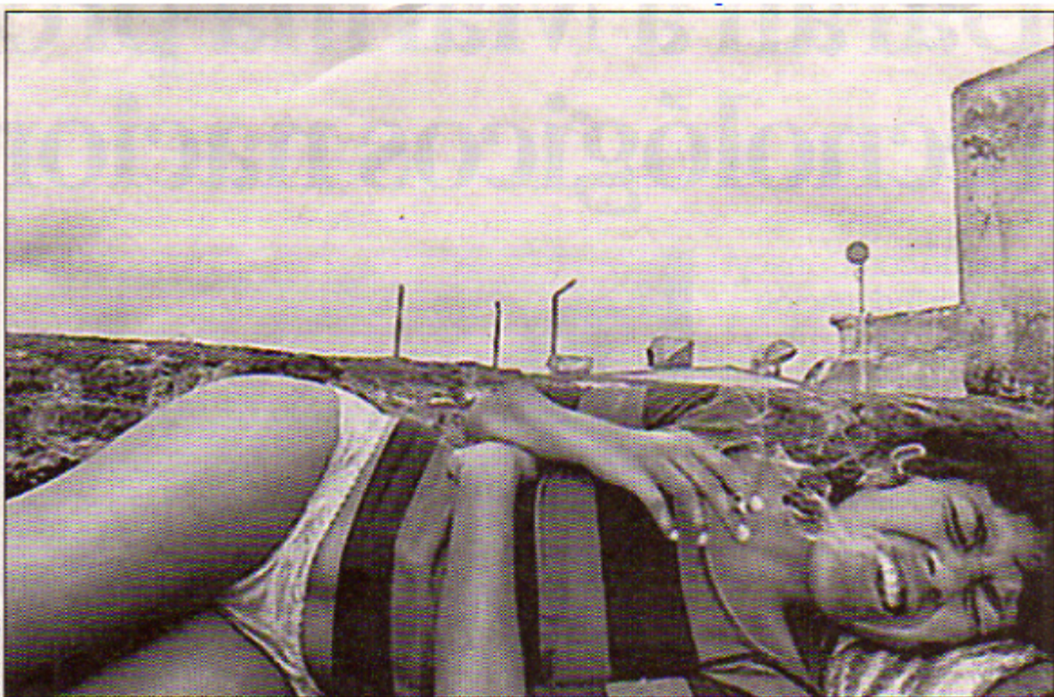
■ POLÉMICA Esta es la obra de Giorgio Viera que desató el escándalo y el rechazo de un grupo de fotógrafos, quienes lo acusaron de haber plagiado la serie de Chien-Chi Chang