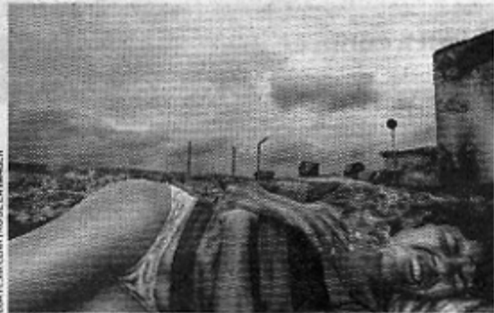
NACE LA POLÉMICA: Viera es el autor de la imagen del lado izquierdo.

GIORGIO VIERA FOTÓGRAFO GANADOR DE LA BIENAL