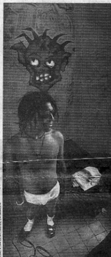
INTIMIDAD: Ambos fotógrafos captaron hombres en ropa interior.

"Son dos escenas de la vida cotidiana, muy parecidas y tomadas de manera semejante, es una sorprendente coincidencia no puedo explicar lo inexplicable, es todo cuanto puedo decir (...)"